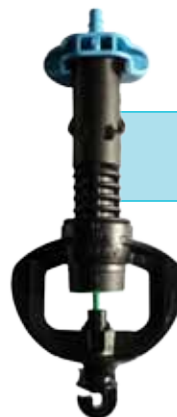
SuperNet™ UD LR STIC , Connecteur d'entrée Auto-taroudante

Codes catalogue manquants disponibles sur demande.