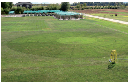
Essais BARENBRUG de stress hydrique (Landlab & Barenbrug Recherche)

* L'indice d'économie en eau est ici obtenu par différence entre les besoins réels en eau du gazon (soit la valeur de l'ETP) et la quantité d'eau effective à apporter à nos mélanges sans altération de leur potentialité (couleur, densité et aspect esthétique)