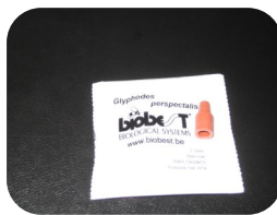
Piège Delta (Ref:007080)