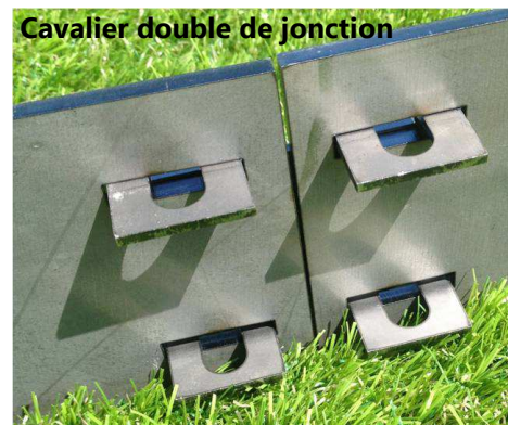
Cavalier double de jonction