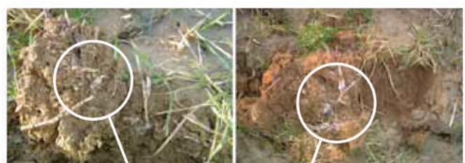
Champignons se développant sur les résidus végétaux